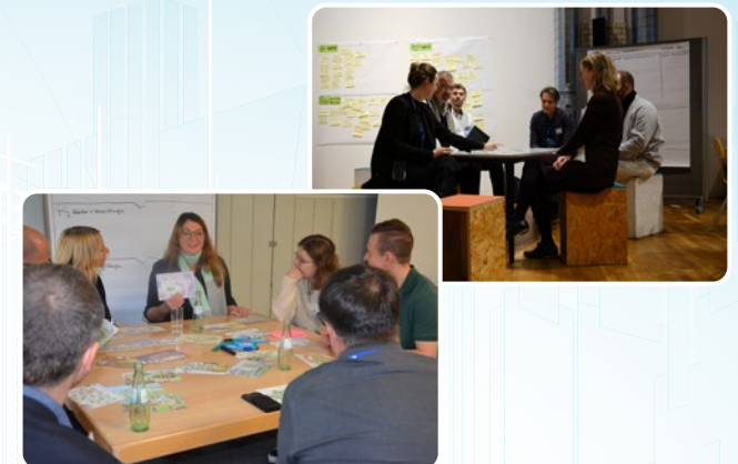
BIRD Outreach-Workshops zu den Vernetzungsaspekten Content und Trust.