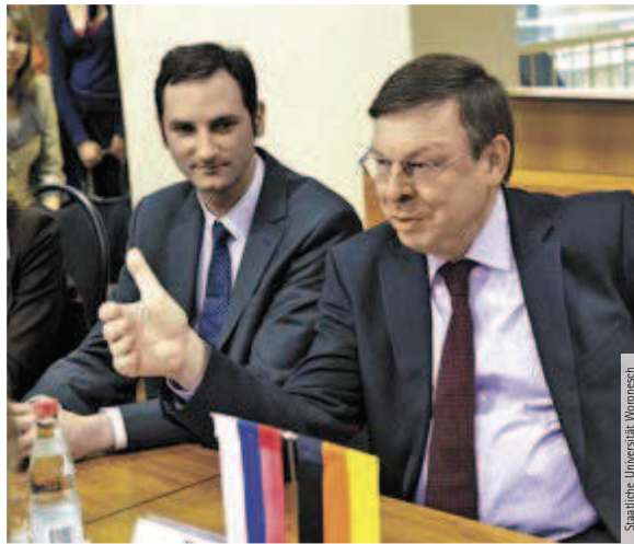
Staatliche Universität Woronesch