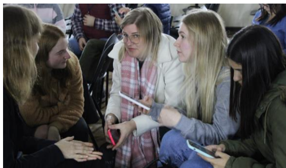
[Workshop mit Studierenden am IFPLA – Juli 2023]