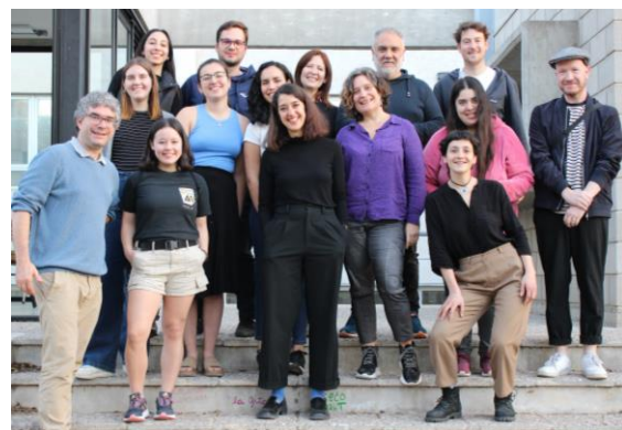
[Arbeits- und Infotreffen an der UNC – August 2023]