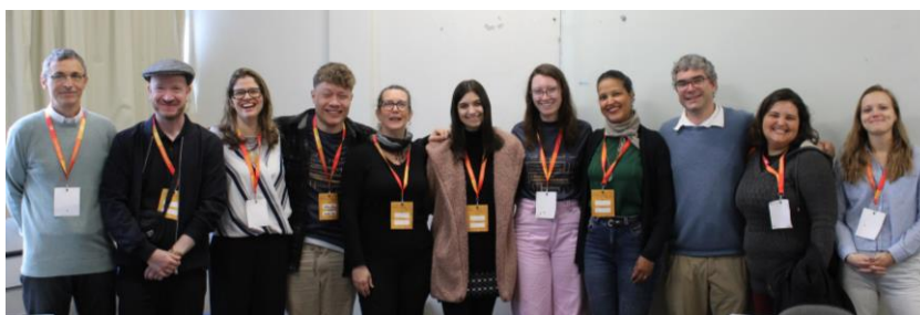
[Team aus Studierenden + Dozierenden beim DL-Kongress ABRAPA – Juli 2023]