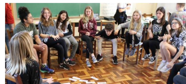
[Mit einer bilingualen Schulklasse in Ivoti – August 2023]