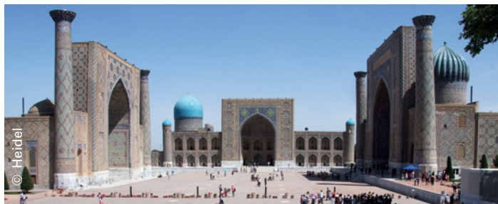
Discover new places on project initiation trips. The Uzbek oasis city of Xiva is a UNESCO World Heritage Site.

Armenia, Azerbaijan, Georgia, Kazakhstan, Kyrgyzstan, Tajikistan, Turkmenistan, Uzbekistan