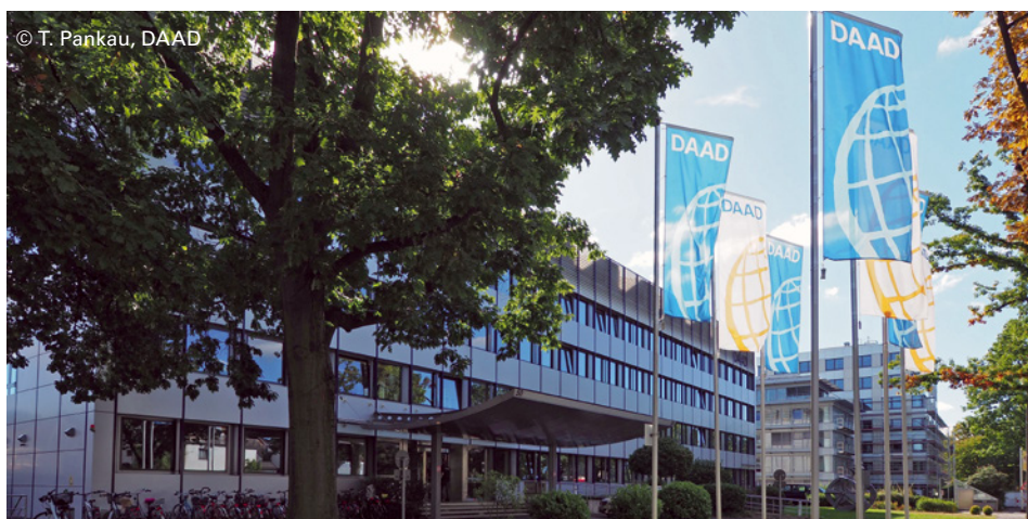
Die DAAD-Zentrale in Bonn

Bundesministerium für Bildung und Forschung