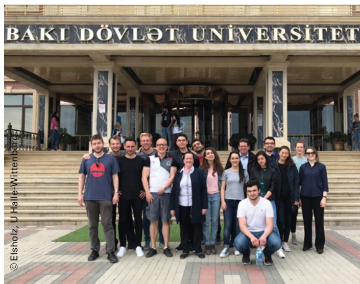
Projektanbahnungsreisen intensivieren den akademischen Austausch mit Südkaukasus und Zentralasien

Die Go East-Förderlinien stärken die Internationalisierung der beteiligten Hochschulen und fördern den akademischen Austausch auf Augenhöhe. Sie steigern das Interesse von deutschen Studierenden und Graduierten für einen Aufenthalt in Ländern Ost- und Südosteuropas sowie des Südkaukasus und Zentralasiens.