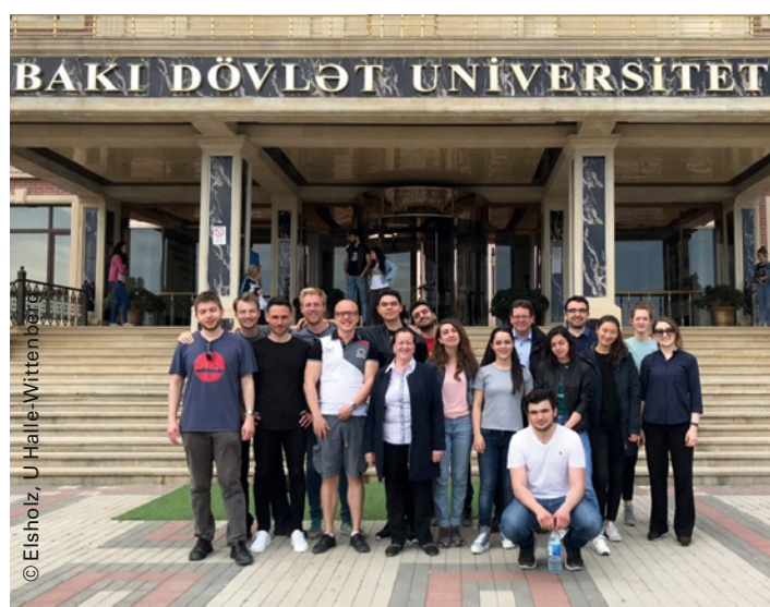
Project initiation visits intensify academic exchange with the South Caucasus and Central Asia.

The Go East funding lines strengthen the internationalisation of the participating universities and promote academic exchange as equals. They increase the interest of German students and graduates in spending time in countries in Eastern and South-eastern Europe, the South Caucasus and Central Asia.