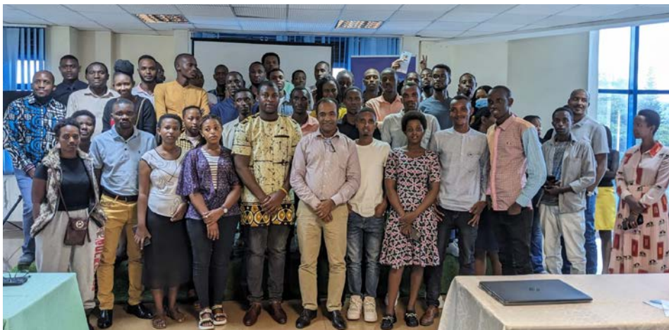
Infoveranstaltung zum Programm Leadership for Africa in Ruanda