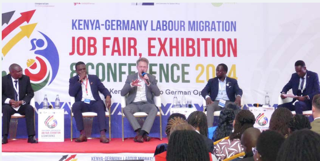
Podiumsdiskussion während der Deutsch-Kenianischen Messe