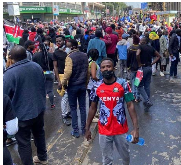
Demonstrierende versammeln sich im Juni 2024 auf den Straßen von Nairobi.

Präsident William Ruto zog das umstrittene Finanzgesetz zurück und machte kurzfristige Zugeständnisse. Doch die Momente des Aufbegehrens, der großen Solidarität miteinander und der Hoffnung, dass ein Wandel vielleicht doch möglich ist, hatten ihren Preis: Die Regierung ging brutal gegen die Protestierenden vor. Nach Angaben der kenianischen Menschenrechtskommission wurden mindestens 63 junge Menschen von der Polizei getötet, Dutzende weitere wurden entführt. Viele Familien suchen noch immer nach ihren vermissten Angehörigen.