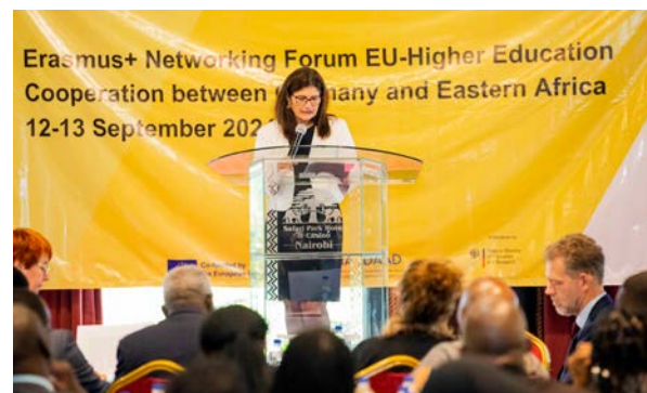
EU-Botschafterin Henriette Geiger bei der Eröffnung des Erasmus+ Networking Forum

Im Jahr 2024 stand die verstärkte Zusammenarbeit der Außenstelle Nairobi mit der EU-Delegation und den Vertretern der Arbeitsgruppe Higher Education and Research Group (Arbeitstitel) der EU-Mitgliedstaaten im Fokus der DAAD-Arbeit vor Ort. Ein Höhepunkt der Aktivitäten im EU-Bereich war das im September 2024 von der Nationalen Agentur für Erasmus+ Hochschulzusammenarbeit des DAAD und dem DAAD-Außenstellenbüro in Nairobi veranstaltete Erasmus+ Networking Forum, zu dem Vertretende von Hochschulen aus sieben ostafrikanischen Ländern (Äthiopien, Burundi, Kenia, Ruanda, Südsudan, Tansania und Uganda) sowie aus Deutschland eingeladen waren.