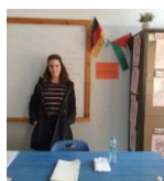
Vielfältige Berufsperspektiven für Absolvent:innen zeichnen sich ab: in Schulen, NGOs, GI, etc.