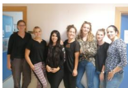
Stipendiatinnen als Teil des Kollegiums während ihres Praktikums im BA DaF Herbst 2019