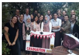
Erster Absolvent:innenjahr- gang des BA DaF 2019