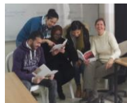
Erster Lehraufenthalt im BA DaF Frühjahr 2019