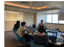
Workshop 2021 in Präsenz und virtuell