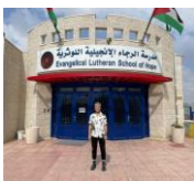
Erschwerte Praktikumsbedingungen wegen längerer Campusschließungen

> geplant: Förderung Nachwuchslehrkräfte im BA DaF und Studie zu weiteren Berufs- und Studienwegen der Absolvent:innen des BA DaF