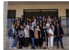
Studierende des BA DaF im Herbst 2021, Rückkehr zu Präsenzunterricht