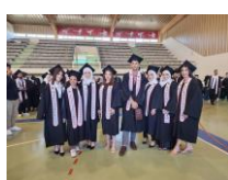
Die jüngsten Absolvent:innen des BA DaF im Sommer 2023

Die GIP Leipzig-Birzeit ist eine langjährige und erfolgreiche Partnerschaft, die ausgeglichene Mobilität erreicht hatte und auch in der Zeit der Pandemie erfolgreich fortgeführt wurde.