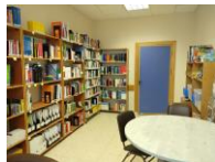
Beginn Aufbau einer Fachbibliothek