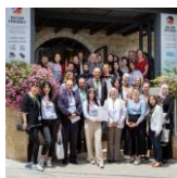
Erster Deutschlehrer:innen-Tag unter Beteiligung des BA DaF und einer GIP-Praktikantin