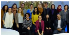
Auftaktworkshop in Birzeit 2017