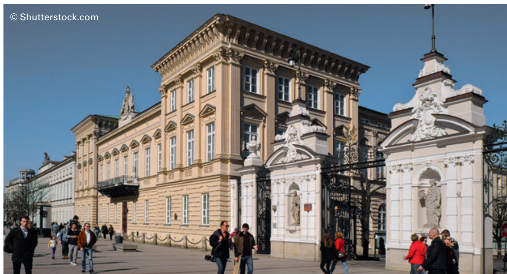
Warschau: Die Universität ist mit 50.000 Studierenden die größte Polens und ein Wahrzeichen der Stadt