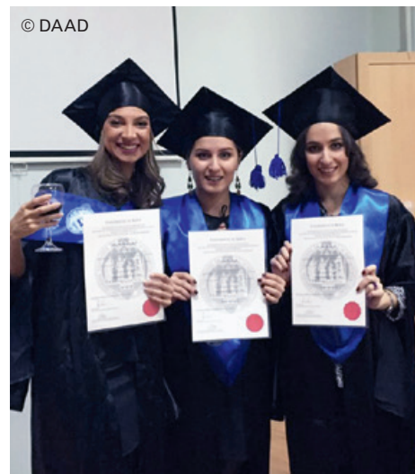
Stolz auf ihr Doppeldiplom: Absolventinnen der Universität Tiflis

Die deutsche Sprache spielt in Mittelost-, Ost- und Südosteuropa sowie dem Südkaukasus und Zentralasien weiterhin eine wichtige Rolle in Wissenschaft und Wirtschaft. Um dieses Potenzial zu nutzen, werden aus Mitteln des Auswärtigen Amtes an Hochschulen der Region Deutschsprachige Studiengänge (DSG) gefördert. Das Programm richtet sich an deutsche Hochschulen, die im Rahmen ihrer Kooperation mit einer Hochschule in der Region ein deutschsprachiges Studienangebot einrichten möchten. Gefördert wird ein breites Spektrum von kompletten Fachstudiengängen bis zu deutschsprachigen Lehrveranstaltungen im einheimischen Studium. Das Programm festigt Deutsch als Verkehrs- und Wissenschaftssprache, die Absolventen sind in ihren Ländern kompetente Ansprechpartner für deutsche Unternehmen und Organisationen. Zudem können die DSG an den ausländischen Partnerhochschulen zu einer Modernisierung der Lehrpläne beitragen und über den Studiengang hinaus auf andere Lehrstühle ausstrahlen.