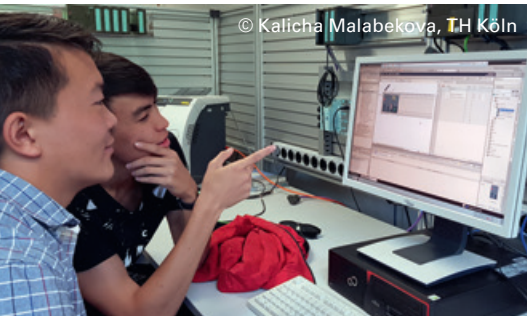
Students work out solutions together at the Telematik Institute (Kyrgyzstan)

Central Eastern Europe, Eastern Europe, Southeastern Europe, South Caucasus, Central Asia