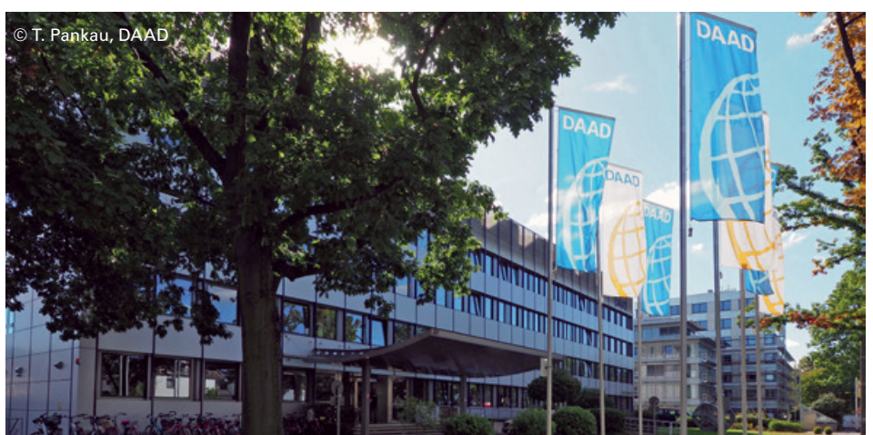
The DAAD headquarters in Bonn

Publisher: DAAD, Kennedyallee 50, 53175 Bonn, www.daad.de , Editor: www.trio-medien.de , Bonn, Layout: grübel-fabrik e.K., Frankfurt a.M., Translation: Jennifer Hatherill, Printed by: Brandt GmbH, Bonn, Print-run: October 2018 - 300, © DAAD