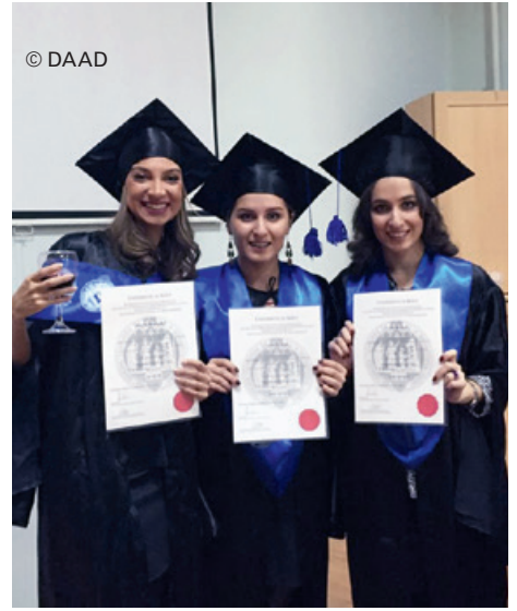
Proud of their double degrees: Graduates of Tbilisi State University

The German language continues to play an important role in science and industry in Central Eastern, Southeastern and Eastern Europe as well as in the South Caucasus and Central Asia. In order to make full use of this potential, the Federal Foreign Office funds German-Language Degree Programmes (DSG) at higher education institutes in the region. The initiative is aimed at German universities that would like to establish study programmes with German as the language of instruction as part of their cooperation with a higher education institute in the region. It supports a broad spectrum of courses ranging from entire specialised study programmes to seminars taught in German as part of a local degree programme. The goal is to consolidate German as a language of communication and science; graduates are competent contacts for German companies and organisations in their countries. In addition, the DSG can contribute to the modernisation of the curricula at the foreign partner institutions and positively influence other chairs above and beyond the scope of the study courses.