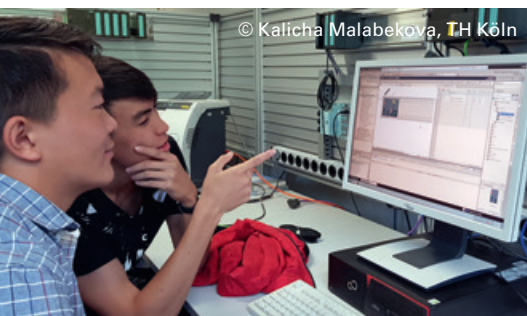
© Kalicha Malabekova, TH Köln Studierende erarbeiten gemeinsam Lösungen im Telematik-Institut (Kirgisistan)

Mittelosteuropa, Osteuropa, Südosteuropa, Südkaukasus, Zentralasien