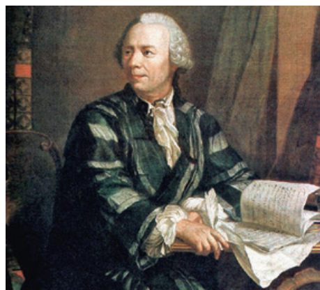
Namesake: Mathematician and physicist Leonhard Euler (1707-1783) taught and researched in Berlin and St. Petersburg. He stands for the academic connection between Western and Eastern Europe

A joint research project strengthens professional and personal relationships. This is exactly what the Leonhard Euler Programme supports by connecting research groups from the countries of Eastern Europe, Central Asia, the South Caucasus and the Western Balkans with scientists from German higher education institutions. Advanced foreign students and doctoral candidates receive a scholarship for their research locally (Sur-Place scholarship) as well as for a short study visit at the German partner university. The programme intensifies the contacts between young foreign researchers and German universities while supporting the students at their respective institutions in their home countries. At the same time it also intensifies contacts amongst higher education institutions as the scholarship holders are jointly supervised by both German and foreign university instructors.