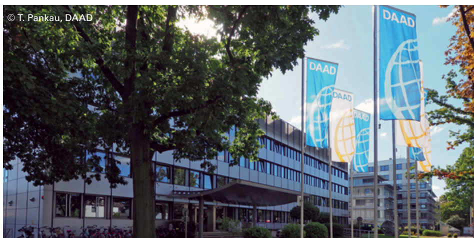
The DAAD headquarters in Bonn

Publisher: DAAD, Kennedyallee 50, 53175 Bonn, www.daad.de , Editor: www.trio-medien.de , Bonn, Layout: grübel-fabrik e.K., Frankfurt a. M., Translation: Jennifer Hatherill, Printed by: Brandt GmbH, Bonn, Print-run: October 2018 – 300, © DAAD