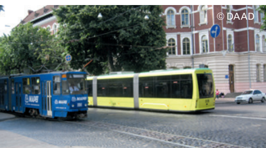
Alt und modern nebeneinander: Straßenbahnen in der Ukraine

Belarus, Republik Moldau, Russland, Ukraine, Südkaukasus, Westbalkan, Zentralasien