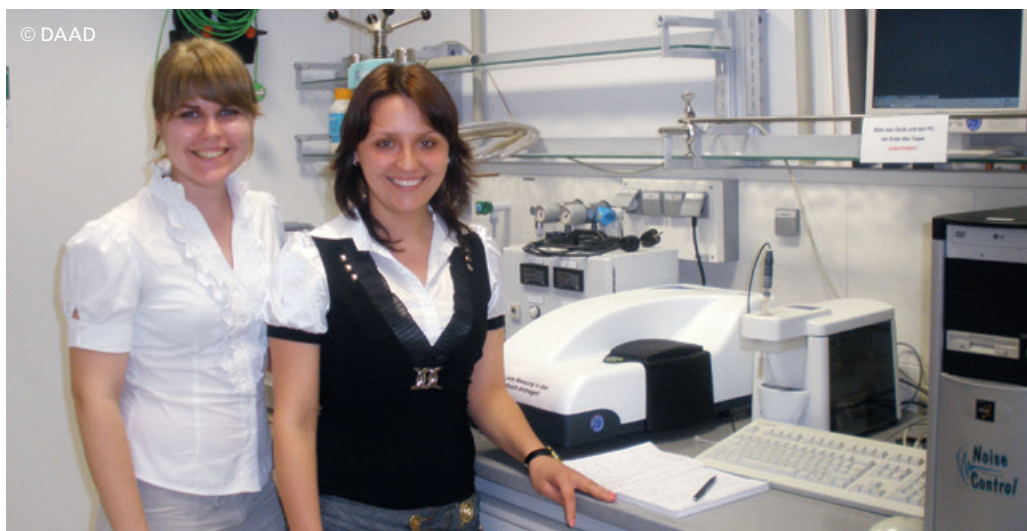
Scholarship holders from Karazin Kharkiv National University, Ukraine, conduct research in the Institute of Inorganic Chemistry at the University of Duisburg-Essen