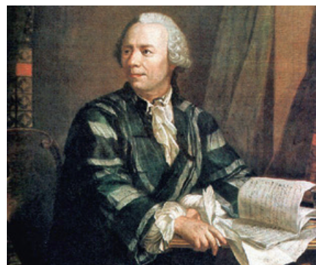
Namensgeber: Der Mathematiker und Physiker Leonhard Euler (1707–1783) lehrte und forschte in Berlin und Sankt Petersburg. Er steht für die akademische Verbindung zwischen West- und Osteuropa

Ein gemeinsames Forschungsprojekt stärkt die fachlichen und persönlichen Beziehungen. Das Leonhard-Euler-Programm verbindet Forschergruppen aus den Ländern Osteuropas, Zentralasiens, dem Südkaukasus und dem Westbalkan mit Wissenschaftlern von deutschen Hochschulen. Ausländische fortgeschrittene Studierende und Doktoranden erhalten ein Stipendium für ihre Forschungen vor Ort (Sur-Place-Stipendien) und für einen kurzen Studienaufenthalt an der deutschen Partnerhochschule. Das Programm intensiviert die Kontakte ausländischer Nachwuchswissenschaftler zu deutschen Hochschulen und fördert dabei ihren Verbleib an den jeweiligen Heimatinstitutionen. Zugleich intensiviert es die Hochschulkontakte, da die Stipendiaten gemeinsam von deutschen und ausländischen Hochschullehrern betreut werden.