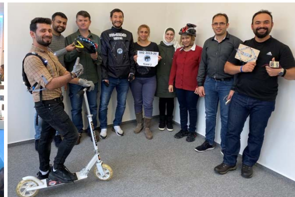
Projektpräsentation IAQ-Teilnehmer 2019/20