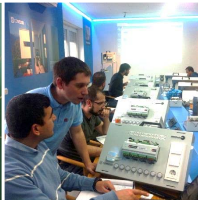
IAQ-Firmenschulung 2017/18 bei der Comexio GmbH in Kerzenheim